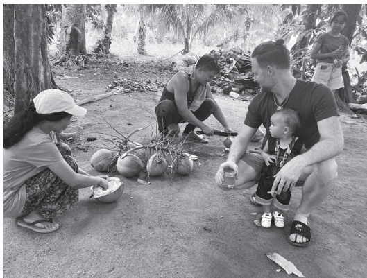
Creyentes cosechan cocos para alimentar a los invitados en la granja familiar.